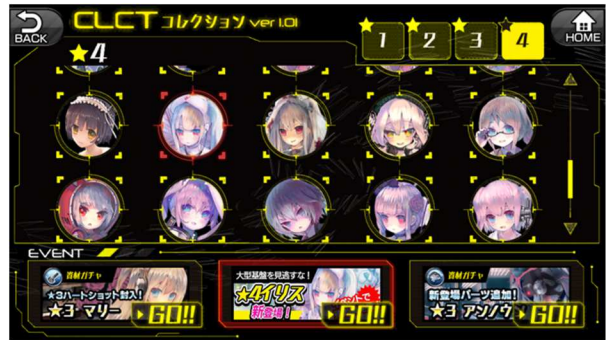
▲コレクションしているドール情報の一覧