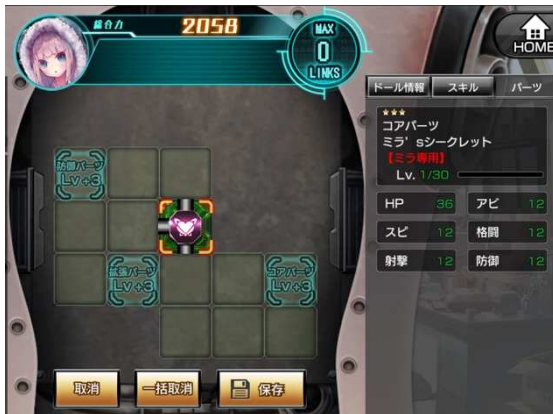
▲ミラ's シークレットと機動突撃型ミラ