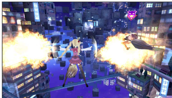
▲（左）アップデート前までの効果、（右）アップデート後、新パーツを装着した効果