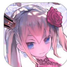
「真空管ドールズ」 アプリアイコン

ゲームタイトル : 真空管ドールズ (読み: しんくうかんどーるず) ジャンル : ドール型ロボット改造シミュレーション メーカー : ソニー・ミュージックエンタテインメント 配信日(予定) : Android Google Playにて配信中 iOS App Storeにて配信中 価格 : 無料(アプリ内課金あり) 対応機種 : Android4.4以上、iOS8.0以降(タブレット含む) コピーライト : ©Sony Music Entertainment(Japan) Inc. 公式WEB : http://www.shinkukandolls.jp 公式Twitter : @shinkukandolls