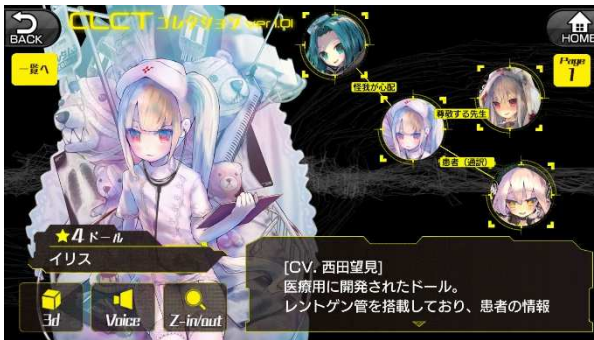
▲ドールの関係性が分かる相関図