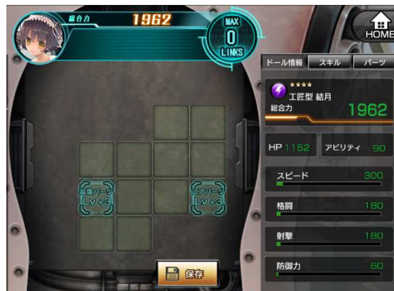
▲工匠型結月(基盤拡張型)