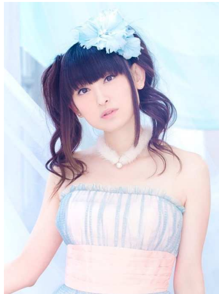
▲「アリア」を担当する声優・田村ゆかり