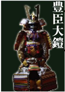
豊臣大鎧 Toyotomi Ooyoroi

Samurai Armor Photo Studioでは、小袖・裁着袴・鎧・兜まで、映画TVで使用されている本物をご用意いたしております。全七領の甲冑。お好みの甲冑を身に着けて、是非侍を感じてください。