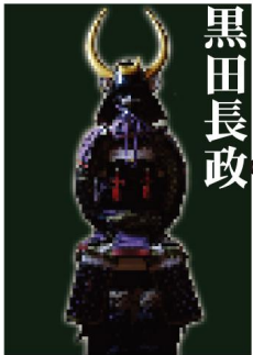
黒田長政 Kuroda Nagamasa