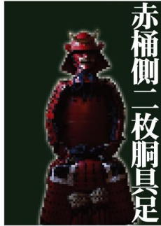
赤桶側一枚胴具足 All-Red Armor Suit