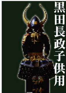
黒田長政子供用 Kuroda Nagamasa (kids)

※ローソンとフグのビル間の道に入ってください。 *Please turn right between Lawson and buildings of the globefish.