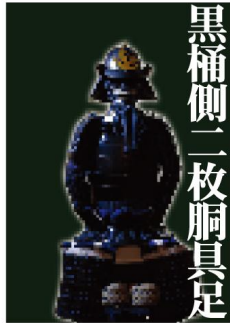
黒桶側一枚胴具足 All-Black Armor Suit