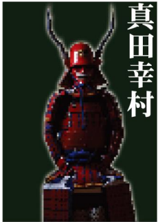
真田幸村 Sanada Yukimura