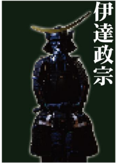
伊達政宗 Date Masamune

Our equipments incl. Kosode, Hakama, Armor and Helmtes are all real, made by experienced craftsmen, which are also used for movies/TVs. We have 7 sets of armors for you to choose from. Wear the armor of your choice and feel Samurai spirit.