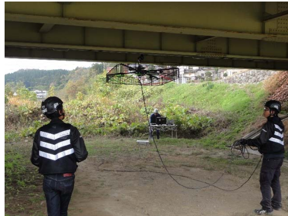
橋梁点検での使用例(イメージ)