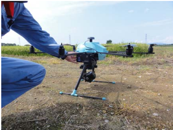
業務に用いるドローン