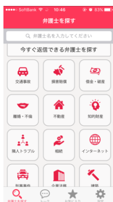
【相談カテゴリ選択画面】

弁護士への相談は心理的にも非常に負担が大きいものですが、本アプリは「ニックネーム」（匿名）で相談できます。個人情報完全に守りながら気楽に利用できます。