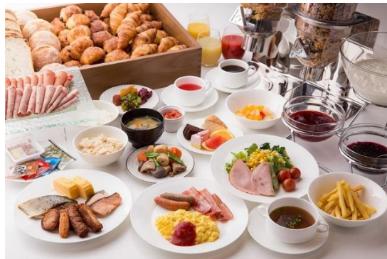
レストラン「Shety」朝食イメージ