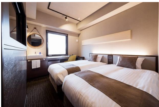
客室 ハリウッドツイン