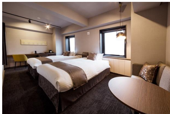
客室 デラックスツイン