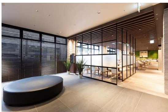
ロビー ~ Shety