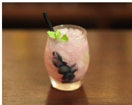
ピオーネ カクテル

「ひやおろし」とは蔵元でひと夏を越し、ちょうどいい頃合いに熟成した秋に出荷される日本酒です。その芳醇さを「チェダーチーズ入り」のまろやかなフレーバーと一緒にお届け。ふくらみのある味わいの「ひやおろし」にぴったりの組み合わせです。