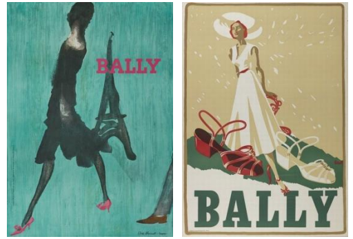
＜バリー アーカイヴポスター 展示一例＞ 左:1963年 Lisa Berset 作 右:1951年 Gerold Hunziker 作

「BALLY LOUNGE」では、通常、バリー創業の地であるスイスのシェーネンヴェルトのミュージアムで保管されている アーカイヴシューズおよびアーカイヴポスターを一般公開 いたします。歴史とクラフツマンシップを感じさせるアーカイヴ展示に囲まれた大人のための空間「BALLY LOUNGE」で、バリーの世界観を存分にお楽しみください。