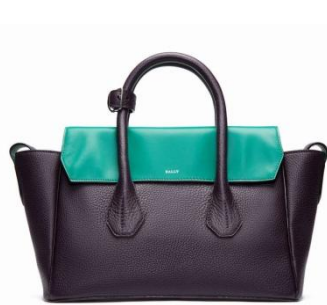
<ウィメンズ オンラインストア限定製品> SOMMET FOLD SMALL (ソメ フォールド スモール) 価格: ¥216,000(税込) カラー: オーベルジン(限定カラー)

また、 メンズの限定製品は、ブランドのアイコン「バリーストライプ」をレザーでさりげなく表現したトートバッグ 。大人の男性に似合うマットな質感とカラーリングで、オン・オフともにお使いいただけます。