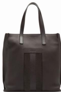
<メンズ オンラインストア限定製品> BLISSON (ブリッソン) 価格: ¥178,200(税込) カラー: サファリ(限定カラー)