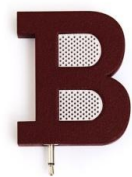
バリー「B」 ポータブルスピーカー

http://www.bally.jp/ja/special-promotion.html