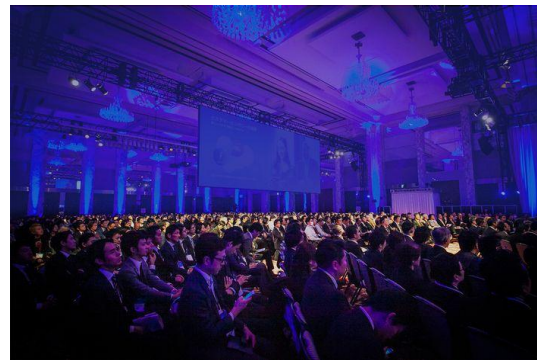
2014年開催「Salesforce World Tour Tokyo」 会場写真

セールスフォース日本法人設立15周年にあたる今年、 特別なプログラムを企画 しています。