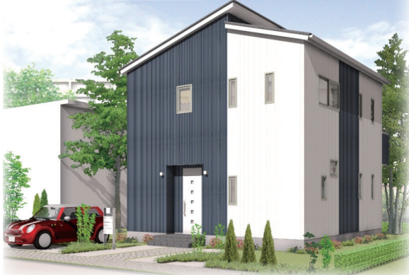
スタイリッシュモダン

長期優良住宅相当、ゼロ・エネルギー住宅(ZEH)対応 (太陽光発電システム 6.05kW搭載)