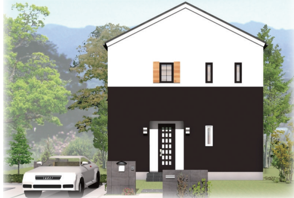
ネオクラシック・ジャパン

長期優良住宅相当、ゼロ・エネルギー住宅(ZEH)対応 (太陽光発電システム 5.06kW搭載)