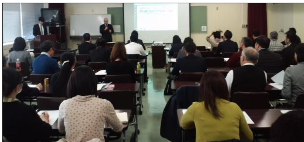
第一回 2016年3月22日開催 東京都セミナー風景（渋谷）