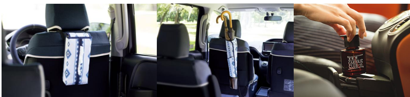
2WAY仕様ティッシュケース