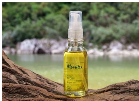
「バイオオイル アルガンオイル」 50mL ¥3,500 (税込¥3,780)

メルヴィータのアルガンオイルはその丁寧な製法、環境へ配慮した生産背景、使用感の良さとともに、高い信頼をいただくメルヴィータのベストセラーです。