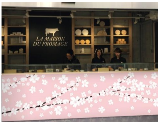
チーズバーイメージ

プレートC: ブルーチーズやウォッシュタイプも含んだプレート。チーズの多様性を体験したい人に！