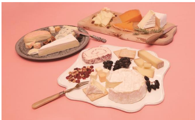
手前から反時計回りに：プレートA、プレートB、プレートC ※チーズの量、皿の形状は実際と異なります