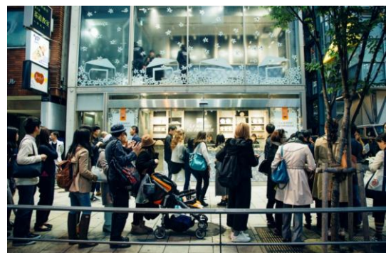
2016年の様子。行列ができるほど大盛況でした