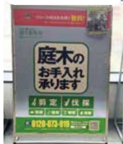
〔南海線中百舌鳥駅〕