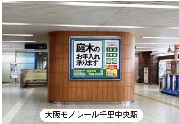
大阪モノレール千里中央駅

掲出中の交通広告は、「庭木のお手入れ」が目立つデザイン。シニア層の視界に入りやすいよう、視線の高さに掲出位置を設定しました。また、戸建てが多いエリアの中でも、エレベーターやエスカレーターのある駅を選定し、移動中でも目に留まりやすい仕様に。「お庭のお手入れ」でお困りの方に届きやすくなっています。