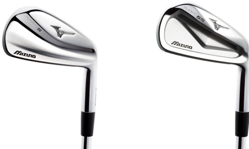
(左)「ミズノ MP-5」 (右)「ミズノ MP-55」

MP シリーズは、伝統と最新の技術が融合し永遠の名器となることを約束する「MODERN CLASSIC」をデザインテーマに、よりゴルファーの感性に響くもの作りを目指しています。