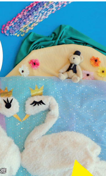
福島県おひるねアート「なないろ」監修

Lily & Allyが福島の子供たちと制作した ふるさと・ふくしまのたからばこ。