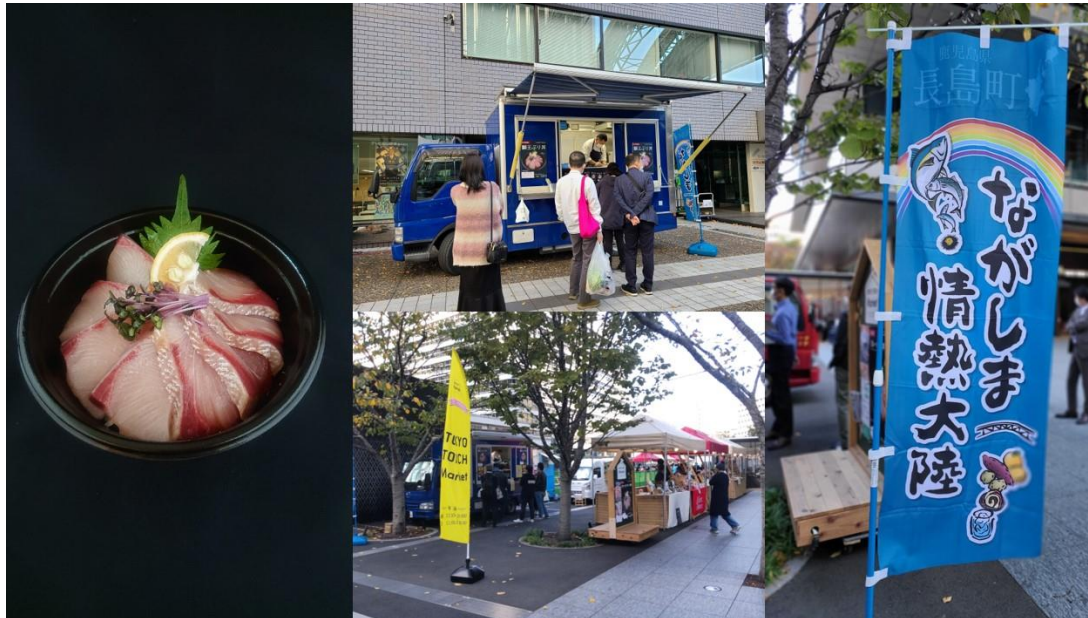
※昨年実施した長島町（鹿児島県）・東神楽町（北海道）の様子