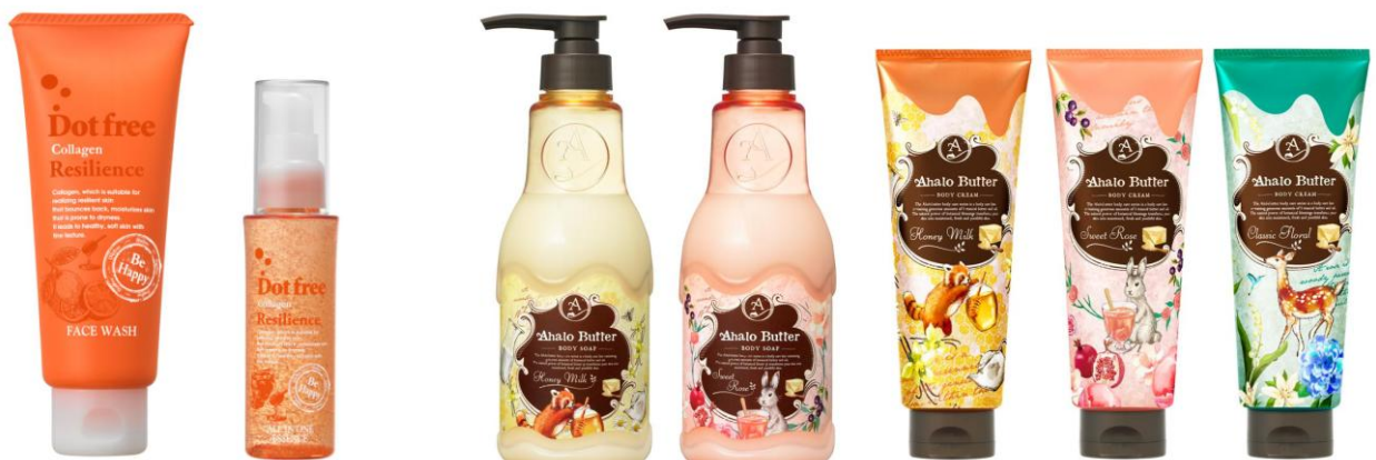
「ドットフリー リシリエンス」 洗顔フォーム&オールインワン美容液 (コスメカンパニー)