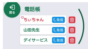
電話帳画面イメージ