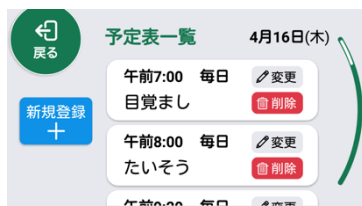
予定表画面イメージ