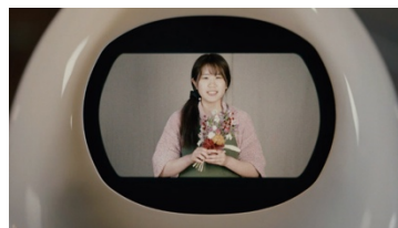
ビデオ通話画面イメージ