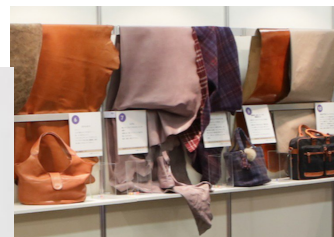
極めのいち素材 展示写真