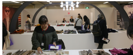
FASHION TREND by Roberto Ricci

デザイナー Roberto Ricci (ロベルト リッチ)氏がセレクトした 2016-17秋冬トレンドマテリアルの展示。