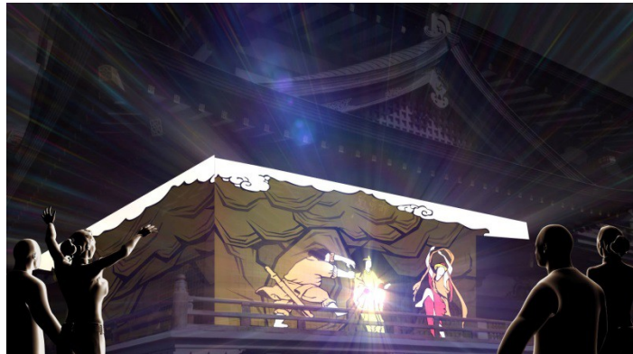
『YOUフェス 光と映像のページェント』イメージ