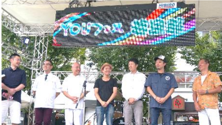
9月5日開会式での「YOU若旦那衆」のお披露目風景

■「YOUまちの駅」とは YOUまちの駅は、YOUエリア（湯島・御徒町・上野）を訪れる来街者と、地元の人々との触れ合いの場所、そしてエリアの魅力を伝えるための地元密着型の情報発信地です。YOUまちの駅では、お土産にピッタリの地元の名産品の販売も実施。さらに、イベント開催期間中は「YOU若旦那衆」（YOUフェスの為に結成されたYOUエリアを代表する4商店会から選ばれた老舗の3代目・4代目若旦那10名）やエリアの魅力を知り尽くした地元在住の主婦や高齢者、地元企業のボランティアなど地元の人達が「YOUコンシェルジュ」として常駐し「ふれる」「そだてる」「つくる」「つながる」のコンセプトの下、訪れた方々にエリアの楽しみ方をご紹介します。 ※「YOU若旦那衆」の詳細： http://youfes.tokyo/info.html