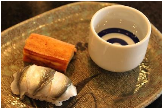
日本酒とお寿司のマリアージュを味わう企画も！