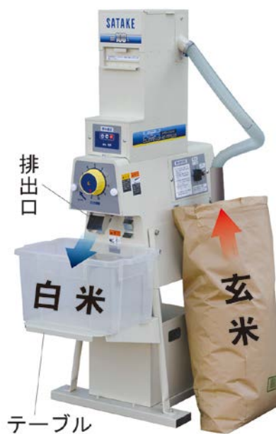
容器に白米を排出