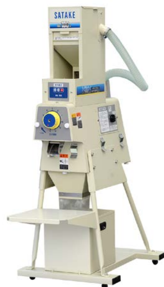
ハイクリーンワンパス