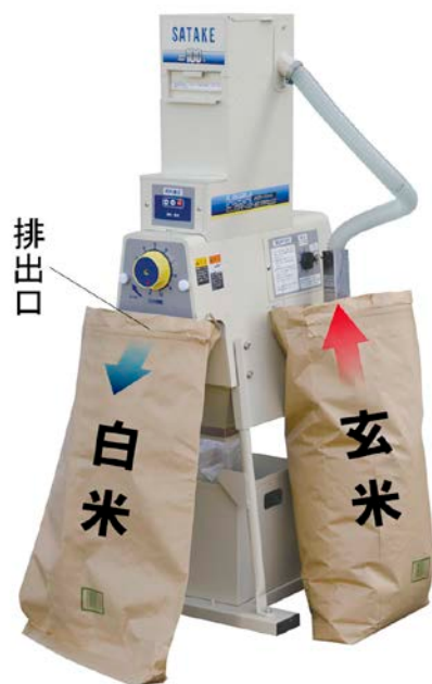
紙袋に白米を排出