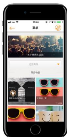
①メニュー一覧 (中国語)