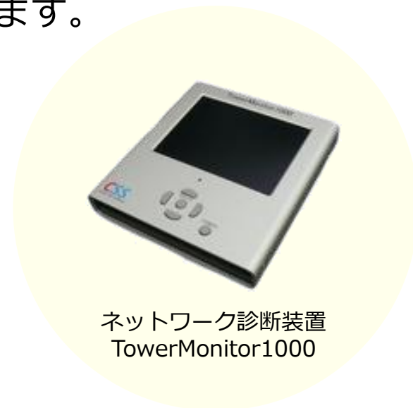
ネットワーク診断装置 TowerMonitor1000