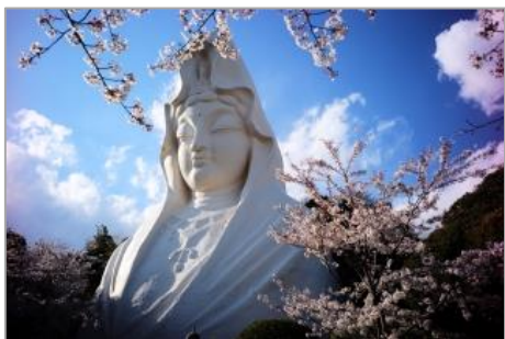
大船観音寺 白衣観音

今回で「かまくら想い」プロジェクトは第三弾となります。第一弾、第二弾では皆様からいただいた寄附で旧鎌倉地区を中心に、観光ルート板や地区案内板の設置を行いました。今回の第三弾では舞台を大船地区に移します。大船地区の顔といえば、大船観音寺の「白衣観音」。大船観音寺の歴史を語る名所掲示板と、大船観音寺に至るための観光ルート板を整備します。皆さまのご支援・ご協力をどうぞよろしくお願い申し上げます。