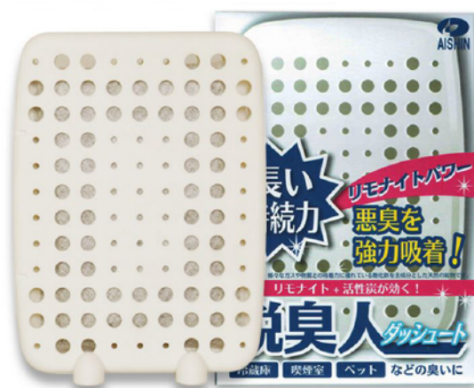
・商品本体外観（左）と商品パッケージ（右）。

たとえば業務用なら、タクシーの車内やゴミ置き場、厨房やトイレ、喫煙室や排水溝まで。家庭用なら、トイレやキッチン、冷蔵庫、玄関やクローゼット、ペットのいる部屋など、幅広い用途に対応。最大10帖 ※ までのスペースなら、安定した効果を発揮します。