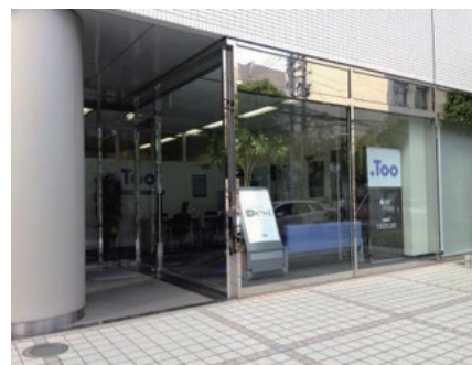
株式会社Too 大阪支社(外観)

https://www.metaworks.jp/event/20160805_mw_swtoo_seminer.html