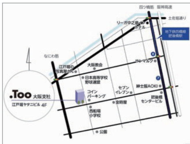
●大阪市西区江戸堀1-25-7 江戸堀ヤタニビル4F