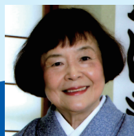
丸々亭 おはぎ 素人作家